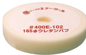
Φ165 ウレタンバフ 外径165×内径30×厚34mm