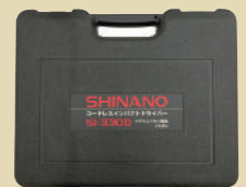
専用キャリングケース