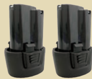
バッテリーパック (2) SI-B1207LA