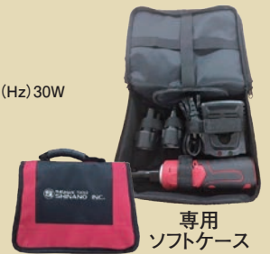
専用 ソフトケース