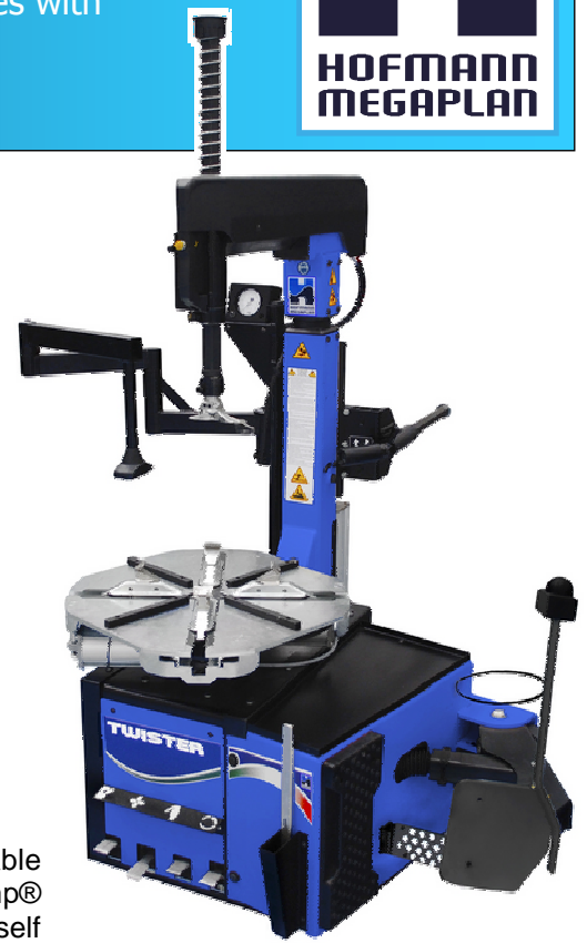
Shown with optional Spider Assist 2 press system

MADE IN EU Designed, and manufactured in ITALY 5 Patents pending®