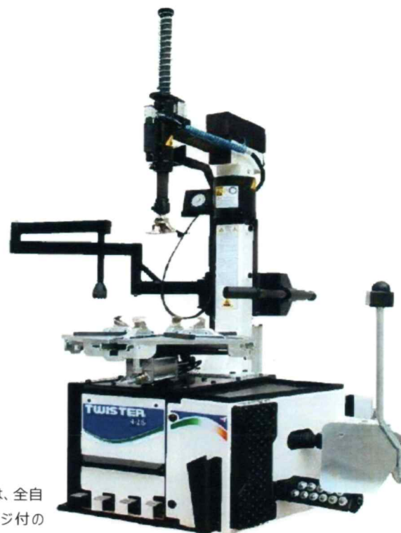
Shown with optional Spider Assist 2 press system